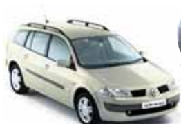
Renault Megane DCI