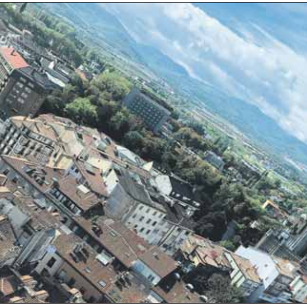
Salburua, et område fra "Det grønne beltet"