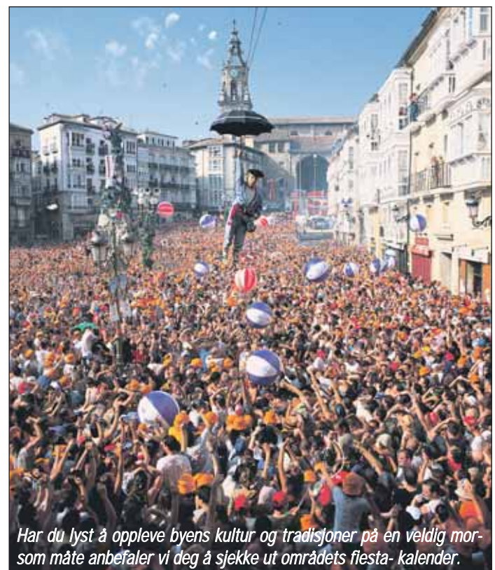
Har du lyst å oppleve byens kultur og tradisjoner på en veldig morsom måte anbefaler vi deg å sjekke ut områdets flesta- kalender.

Og frister det med tradisjonell mat fra regionen, ta turen til Victófer eller Cafés Eguía.