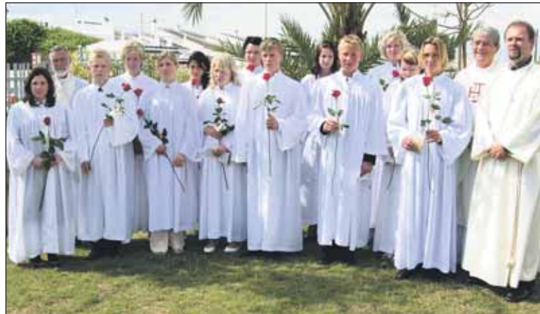
Den 1. april i år stod til sammen 25 flotte ungdommer til konfirmasjon i Alfaz del Pi og Torrevieja.