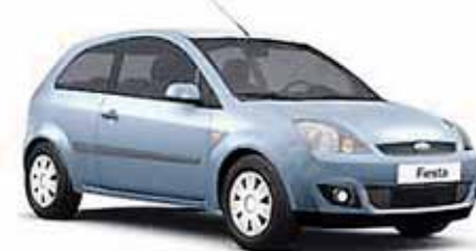
Ford Fiesta Trend