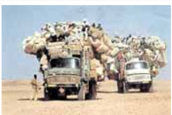
Et lite flyttelass