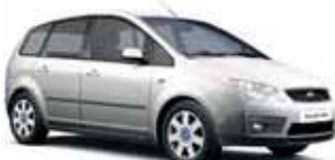
Ford CMAX Trend