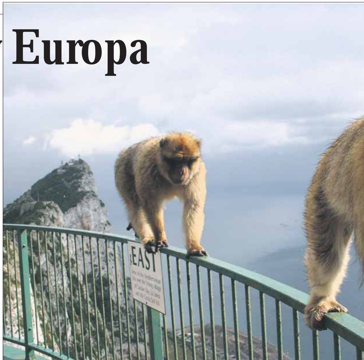
PÅ KANTEN: Med Gibraltarklippen i bakgrunnen og stor fallhøyde spankulerer to barbariske aper med den største selvfølgelighet.

I tillegg til å se Gibraltar fra luften, er det flere som tilbyr å ta deg til sjøs for å se delfiner. Noen av turarrangørene reklamerer med 95 prosent sjanse for å se delfiner og kan-