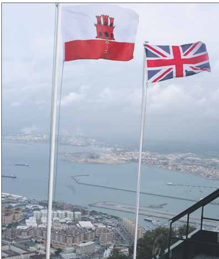
Folkeavstemninger i 1967 og 2002 har slått fast at Gibraltar fortsatt skal være under britisk flagg.

TIL TOPPS: En taubane tar deg til toppen av Gibraltar i løpet av fem minutter. Eller du kan velge å kjøre oppover fjellet med bil.