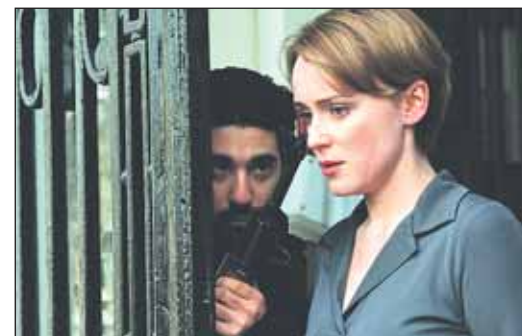
SKYGGER - Britisk krimserie. Sesong 1. (3:6) Med Olga Sosnovska, Jenny Agutter, Megan Dodds, Peter Firth, Natasha Little, Rupert Penry-Jones og David Oyelowo. Torsdag 26/4 kl 21.35.

07.30 Stå opp! 07.31 Den lille røde traktoren 07.40 Lisa 07.50 Teddy og Annie 08.00 Kalle og Molo 08.25 Bravo Bibbi! 08.40 Disneytimen 09.35 SvampeBob 10.00 Mánáid-tv - Samisk barne-tv 10.15 Dunder 10.45 Jorda rundt på 80 dager 13.30 Gunnell i det grønne 14.00 Troens røtter 14.30 Der fartøy flyte kan 15.00 Med design i lomma 15.55 Det beste av Bejart 17.30 Åpen himmel 18.00 Barne-tv 18.00 Pippi Langstrømpe 18.30 Newton 19.00 Søndagsrevyen 19.45 Sportsrevyen 20.00 Helleristerne 21.00 Gledens hus 23.15 Kveldsnytt 23.35 Dok1: Historien om Natascha Kampusch 00.25 Nytt på nytt 00.55 Ingen grunn til begeistring