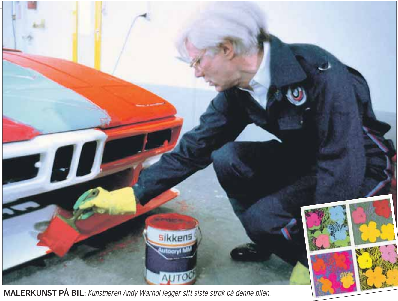
MALERKUNST PÅ BIL: Kunstneren Andy Warhol legger sitt siste strøk på denne bilen.