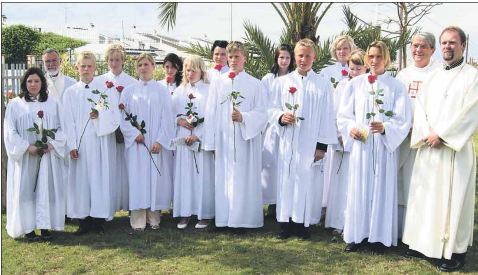
13 FLOTTE UNGDOMMER STOD TIL KONFIRMASJON I TORREVIEJA