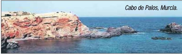
Cabo de Palos, Murcia.

I februar i år ble 6 hvaler funnet døde utenfor Algeciras like ved Gibraltar. Dødsårsaken ble ikke fastsatt da kroppene var i for dårlig stand til å kunne undersøkes, men det utelukkes ikke at det kan være Morbilliviruset. Det finnes foreløpig ingen vaksiner mot viruset.