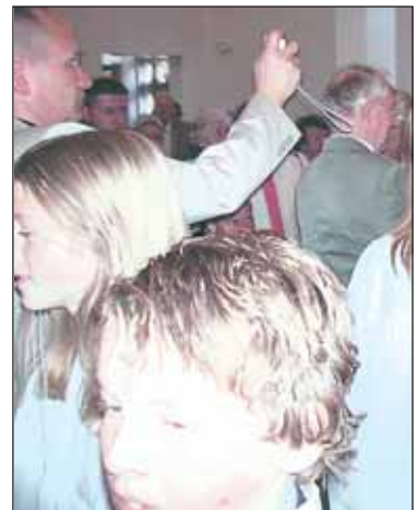
OVER: Mange ivrige fotografer i en fullsatt Minnekirke.

På samtalegudstjenesten ble det vist kortfilmer som konfirmantene selv hadde laget med viktige temaer som er relevante i vårt samfunn, spesielt for dagens ungdom.