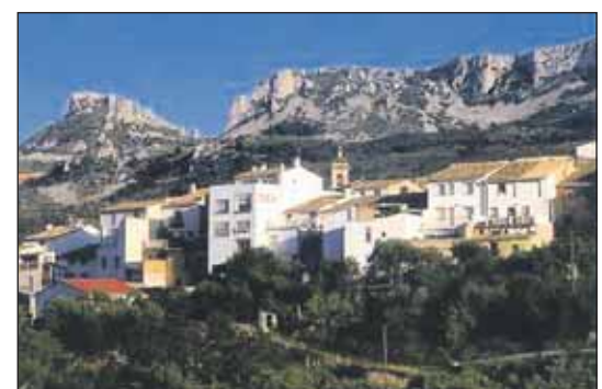
FØLGER MED I TIDEN: Den lille byen Confrides i Guadalest-dalen er nå på nett.

Den lille byen Confrides i Guadalest-dalen har tatt et steg inn i det 21. århundre da de nå endelig har fått bredbånd. Seks familier har nå installert ADSL i byen og følger dermed utviklingen i takt med resten av landet.