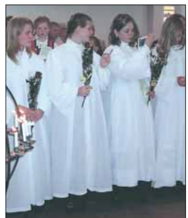
UNDER: Konfirmantene fikk utdelt hver sin røde rose som symboliserer kjærlighet.