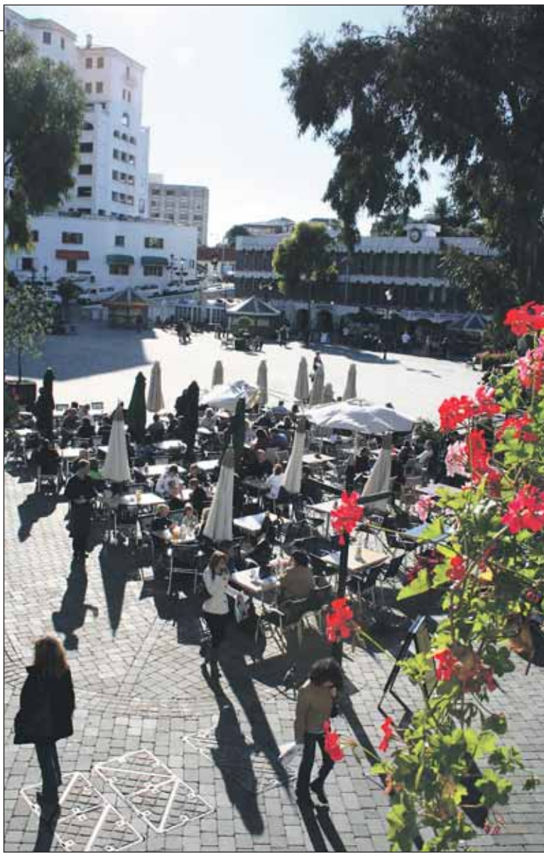
CASEAMATES SQUARE er en hyggelig samlingsplass med en rekke ute-serveringssteder.

plass med flere muligheter til å slukke tørsten og mette magen. Mens du koser deg i solskinnet, kan du la tankene fare til fortiden, da dette var stedet de verste kriminelle måtte bøte med livet.