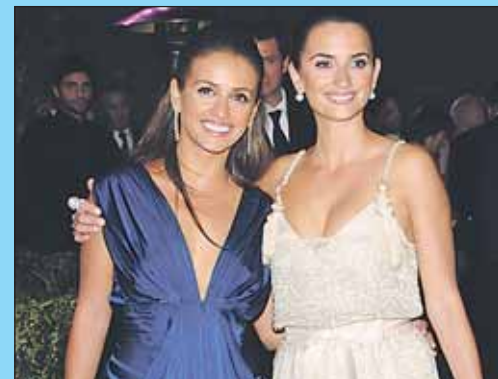
Cruz-klærne vil være tilgjengelig i 80 prosent av Mango-butikkene.

Det er ikke første gang Mango får kjente personer til å fronte deres design. Milla Jovovich har både designet kolleksjoner og frontet reklamekampanjer for den spanske kleskjeden.