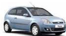
Ford Fiesta Trend